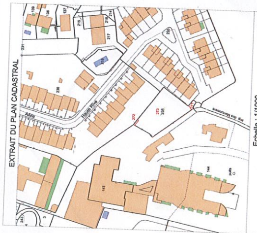
Echelle : 1/1000