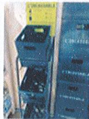
Meuble de collecte