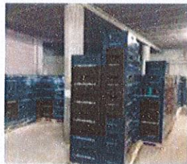
Casiers de collecte