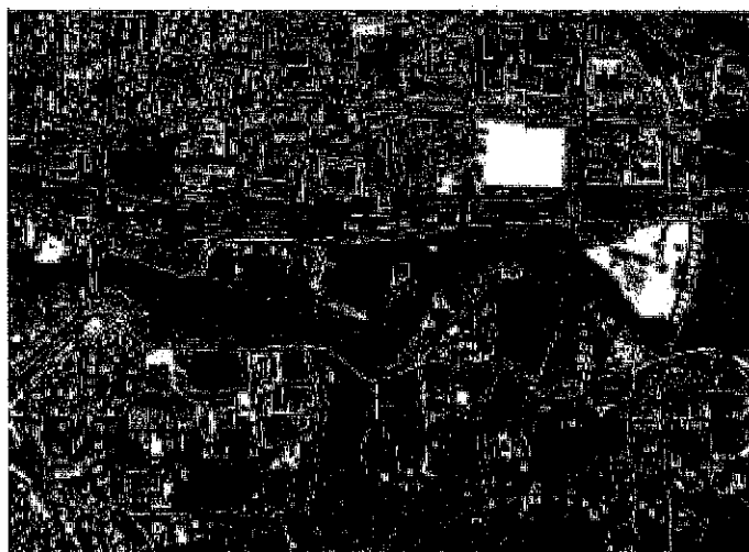
Figure 1 : plan de situation par rapport au centre-ville