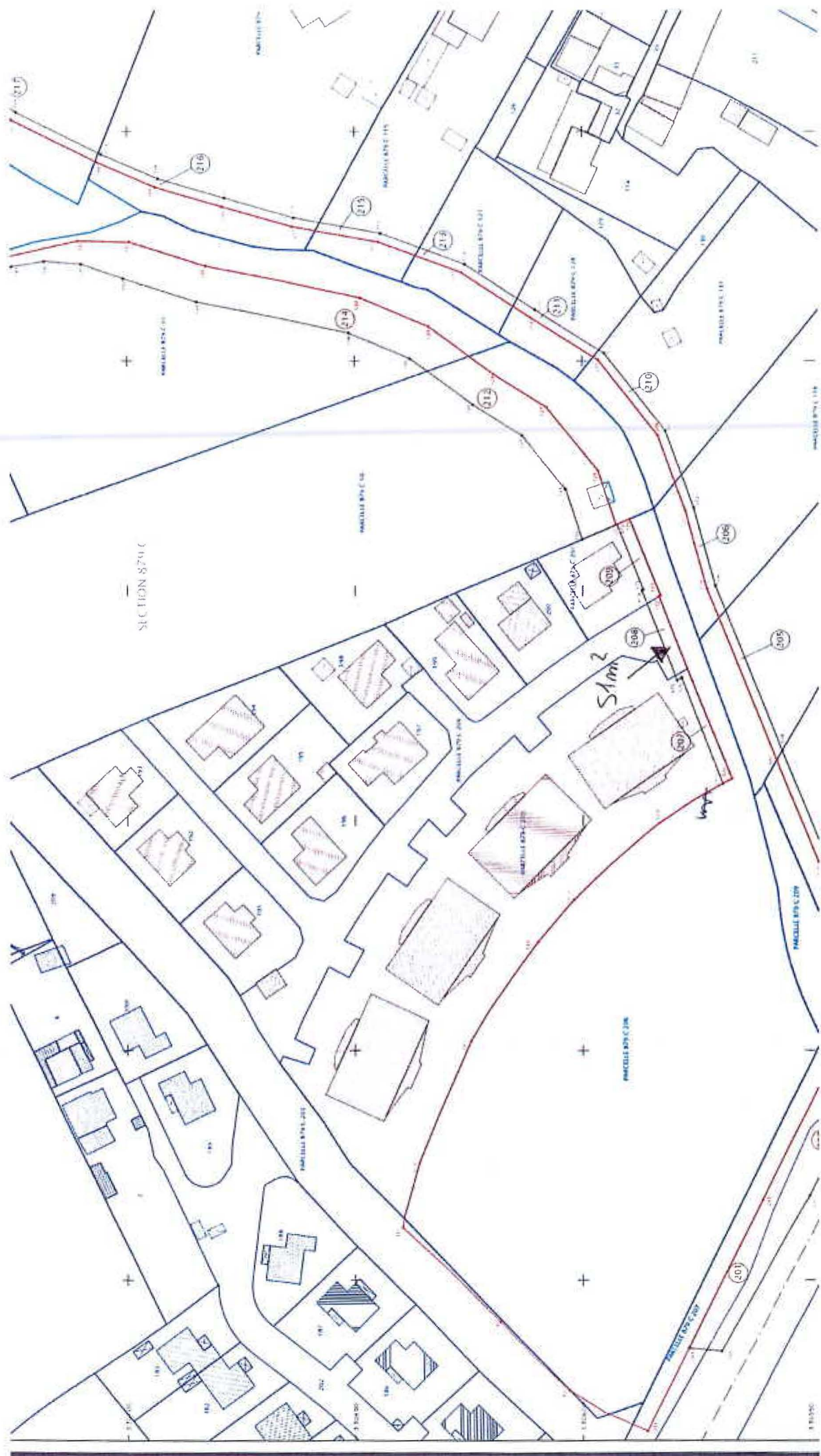
Annexe 1 : Plan de l'occupation Temporaire